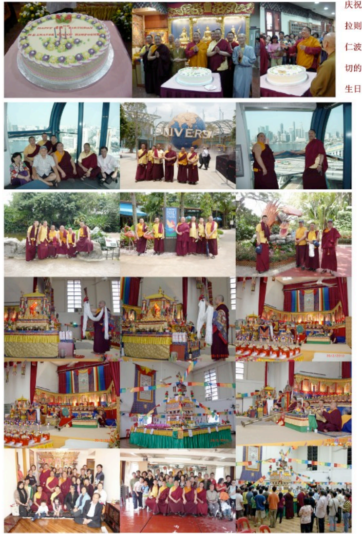
2010年在新加坡及香港举行二十一度母、财神及方生等法会之照片展