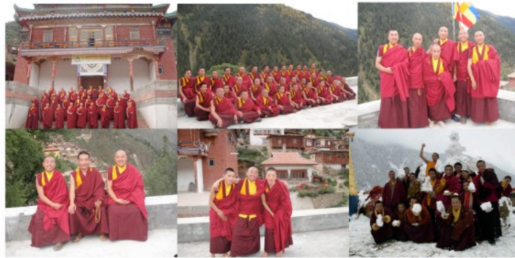
中国四川甘孜州色达县拉则寺密法胜义禅林的明觉佛学院僧侣全体合照