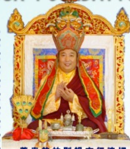
尊貴的拉則祖古仁波切 H.E. LHATSE TULKU RINPOCHE

藏傳佛教有一套嚴謹完整的修行方式與次第,稱為「四加行」。四就是有四種「加行」就是準備進入佛法之流,轉凡心向解脫道的先前準備工作。這是佛家對生命本質的四種知見,是小乘,大乘,金剛乘三乘必須共同奉行教理,以糾正不正確的認知,進而鞏固學佛的信心。為懺罪積資的基本工作,被視為作重要修持前的一種準備工作也同時是終生修持乃至成佛以前都必須不斷修習的法門。