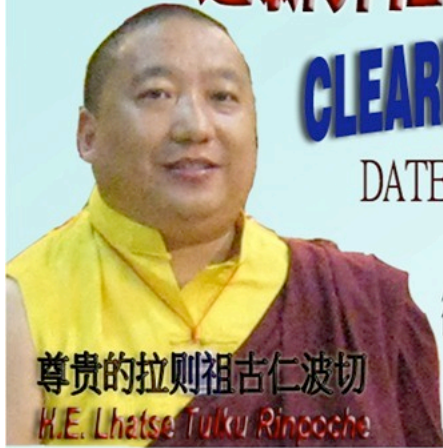
尊贵的拉则祖古仁波切 H.E. Lhetse Tuku Rinpoche